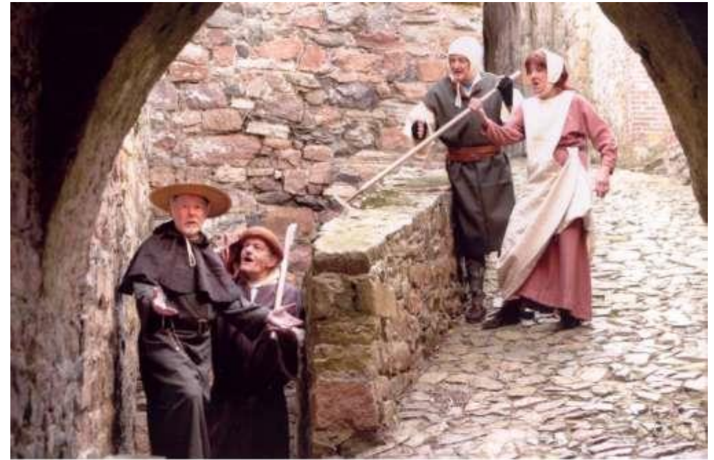
Spectacles de reconstitution historique.