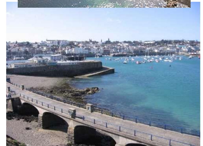
Abords du château.